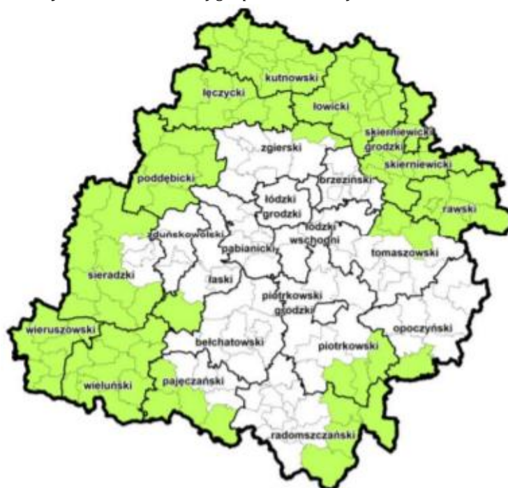
Rys. 1 Obszar zielonej gospodarki w województwie łódzkim.